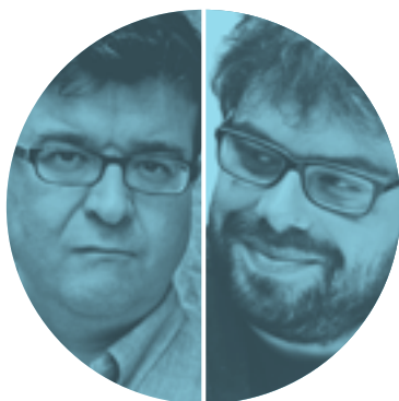
IZQ. JAVIER CERCAS DCHA. SERGIO DEL MOLINO