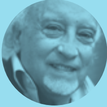
MANUEL VICENT 28 DE OCTUBRE | 20.15H