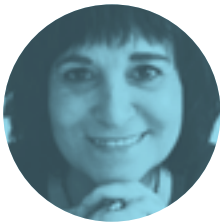
ROSA MONTERO 26 DE OCTUBRE | 19.00H