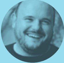
NIÑO DE ELCHE 27 DE OCTUBRE | 21.30H