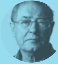
FÉLIX DE AZÚA 27 DE OCTUBRE | 19.15H