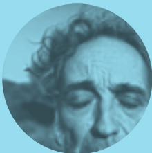
ALBERTO GARCÍA-ALIX 28 DE OCTUBRE | 13.00H