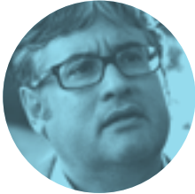
JUAN MANUEL DE PRADA 25 DE OCTUBRE | 20.00H