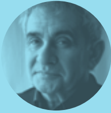
BERNARDO ATXAGA 28 DE OCTUBRE | 18.15H