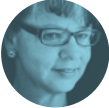
PIEDAD BONNETT 31 DE OCTUBRE | 20.00H