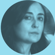
ELVIRA NAVARRO 28 DE OCTUBRE | 17.00H

Dos de los más destacados autores de la penúltima generación poética leerán sus poemas (algunos inéditos) y darán cuenta de dos de las estéticas más sugerentes del panorama de la poesía actual: desde el pensamiento y la fibra metafísica de Oliván al intenso collage de lenguajes de Valero.