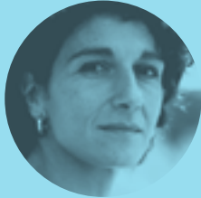
MARINA GARCÉS 28 DE OCTUBRE | 18.30H

Una docena de montajes avalan a este dúo catalán de dramaturgos, actores y directores. El Premio Ojo Crítico 2016 impulsó algo más su creciente estela. Destacan por su lenguaje escénico contemporáneo, su talento y los riesgos asumidos en sus propuestas, aunando distintas disciplinas teatrales que los sitúan en el centro de las más sugerentes aventuras teatrales de ahora.